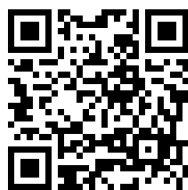
高崎公演 はこちら